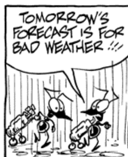
Swamp cartoons used with permission. More can be seen at www.swamp.com.au