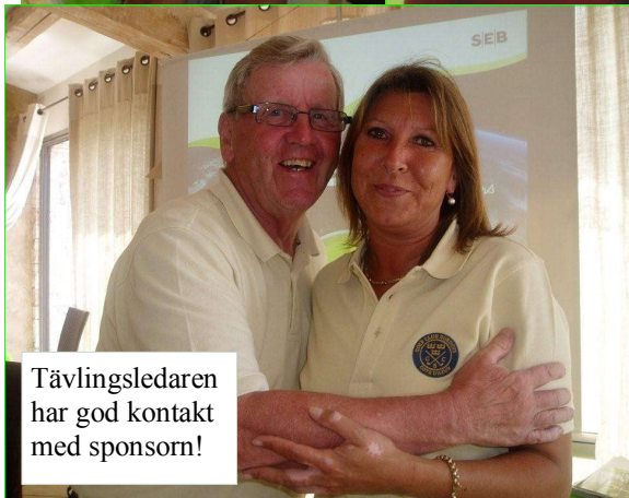
Tävlingsledaren har god kontakt med sponsorn!