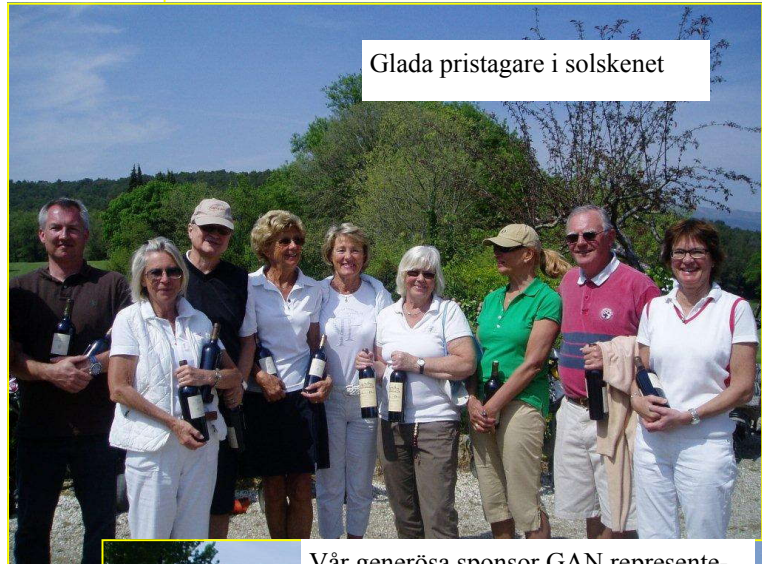
Glada pristagare i solskenet